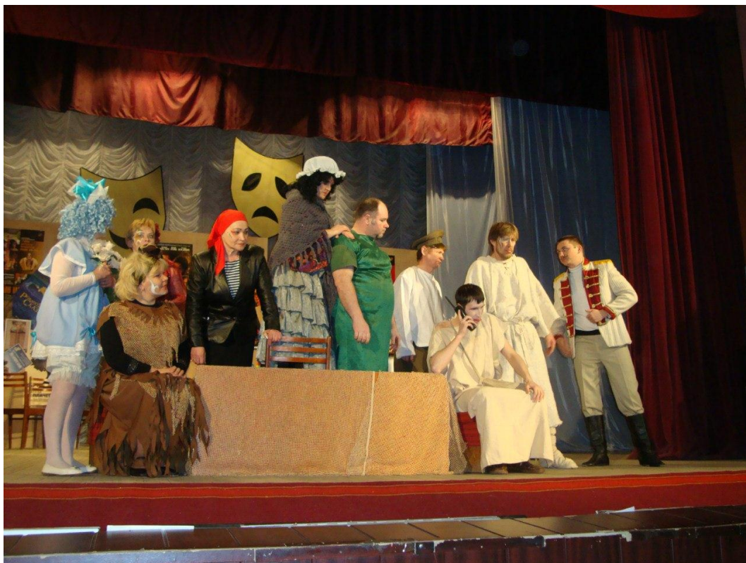
Приложение 9. Фотография со спектакля «По самому краю».