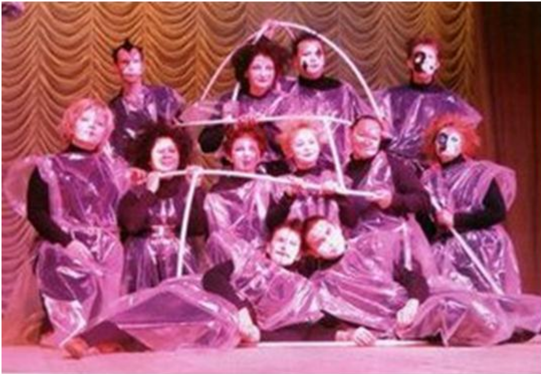
Приложение 7. Фотография со спектакля «Я пришел дать вам волю».