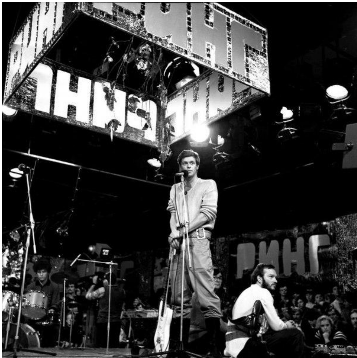
Выступление группы «Аквариум» в передаче «Музыкальный ринг».