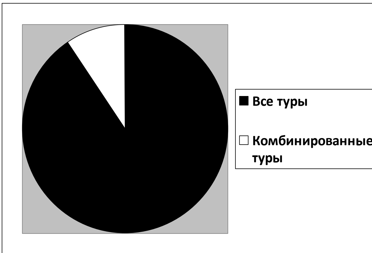
Рис. 1. Соотношение комбинированных и обычных туров в предложениях пермских турфирм.