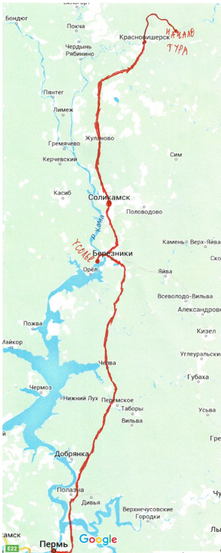
Маршрут всего тура