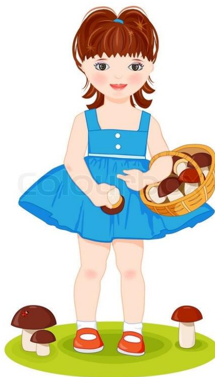
«Девочка собирает грибы»