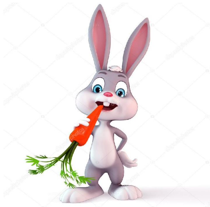
«Зайчик грызет морковку»