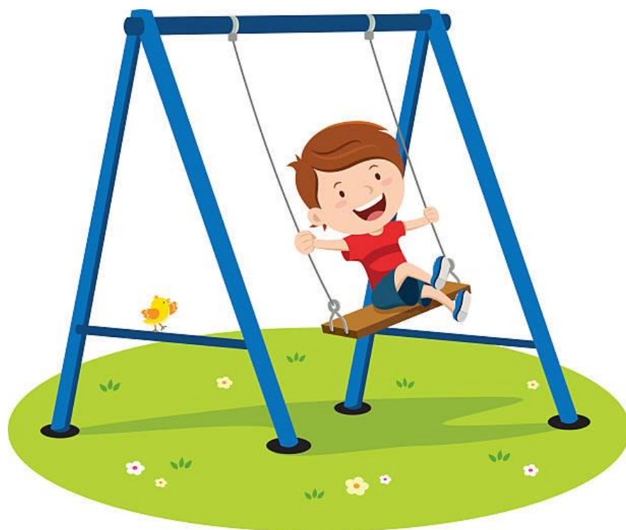
«Мальчик качается на качелях»