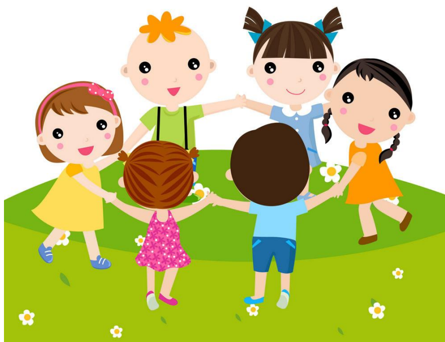
«Дети водят хоровод»

Необходимо ответить на вопрос: «Что изображено на картинке?»