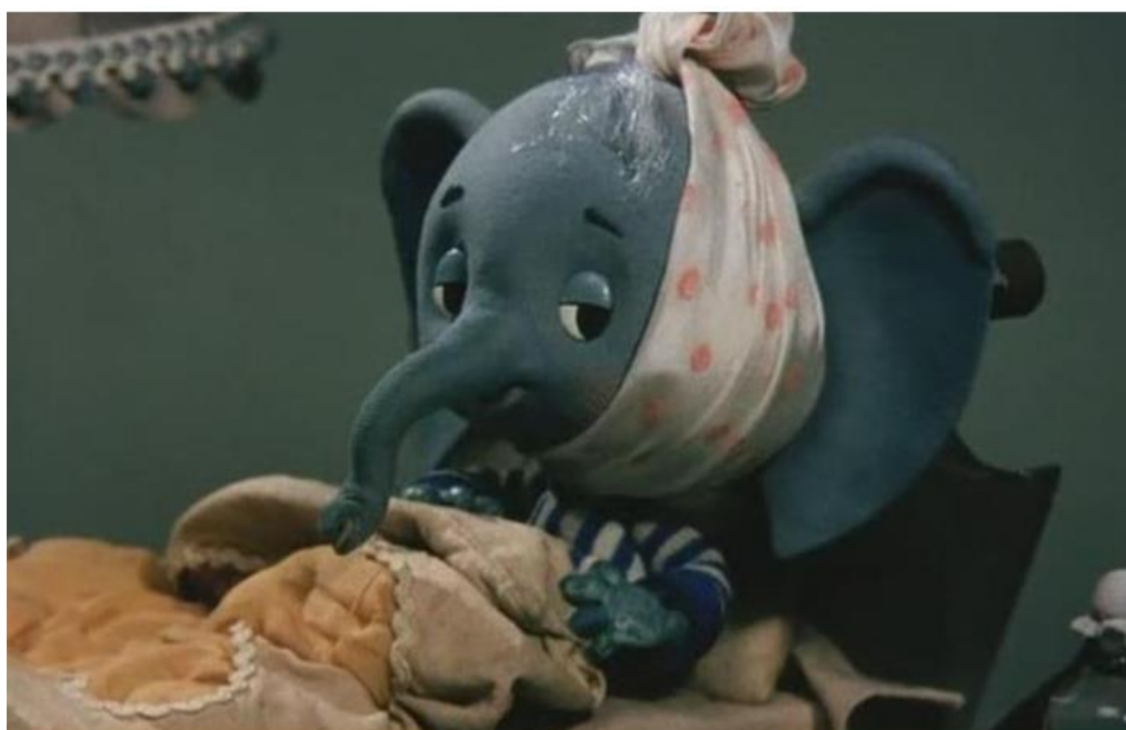
«У слоника болит зуб»