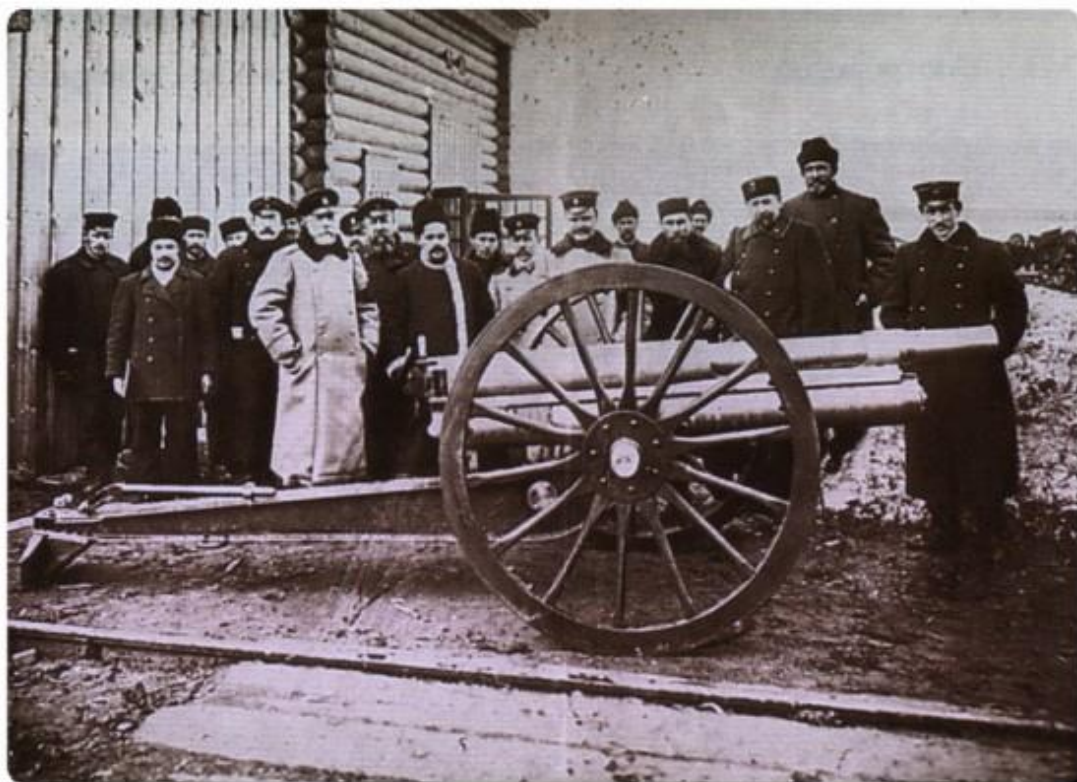
Группа рабочих завода на полигоне.