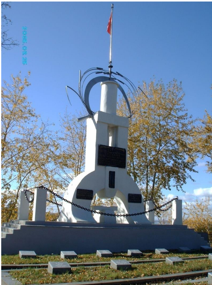
Памятник участникам Первой русской революции в Мотовилихе 1905-1907 годов.