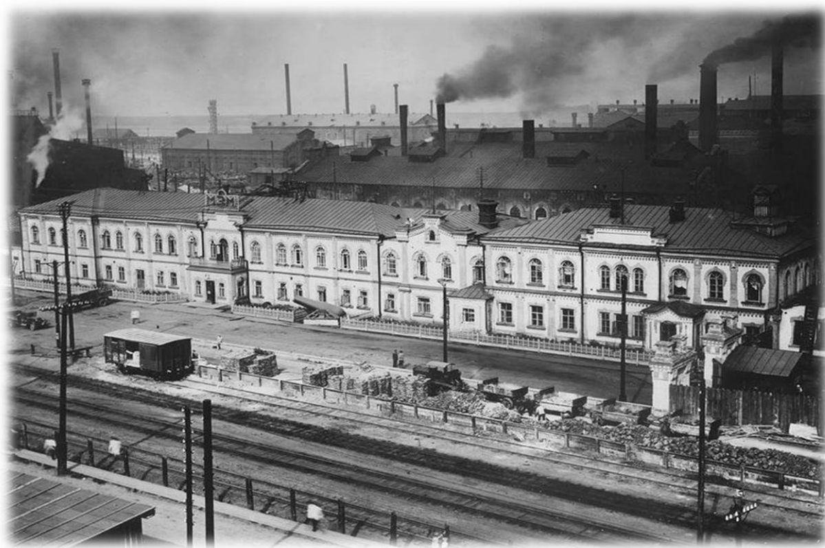
Заводоуправление Пермских пушечных заводов.